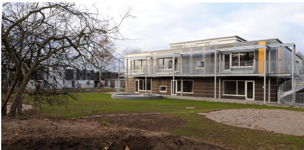
Sydstjernen, Albertslund syd