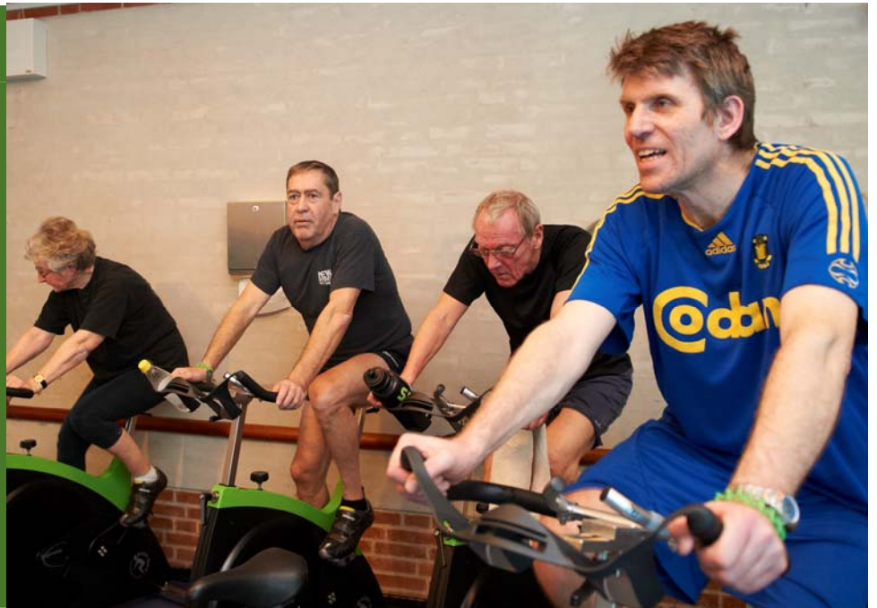
Spinning er et af Albertslund Idrætsanlægs nye, sundhedsfremmende tiltag.