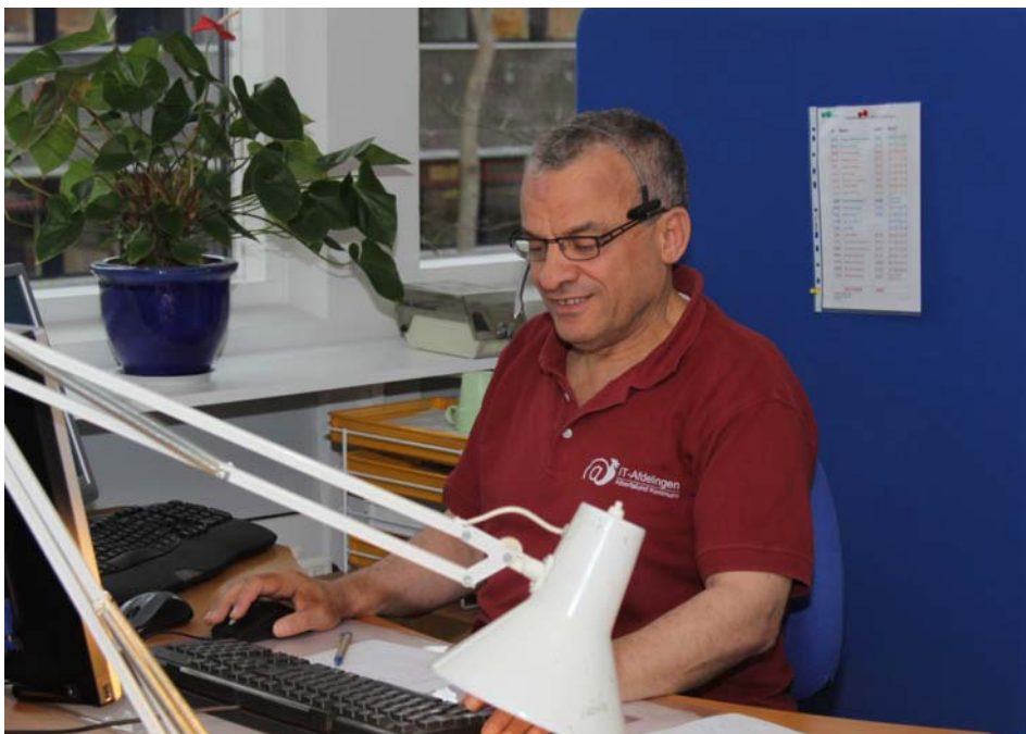
IT Helpdesk hjælper hele kommunen med IT relaterede spørgsmål.