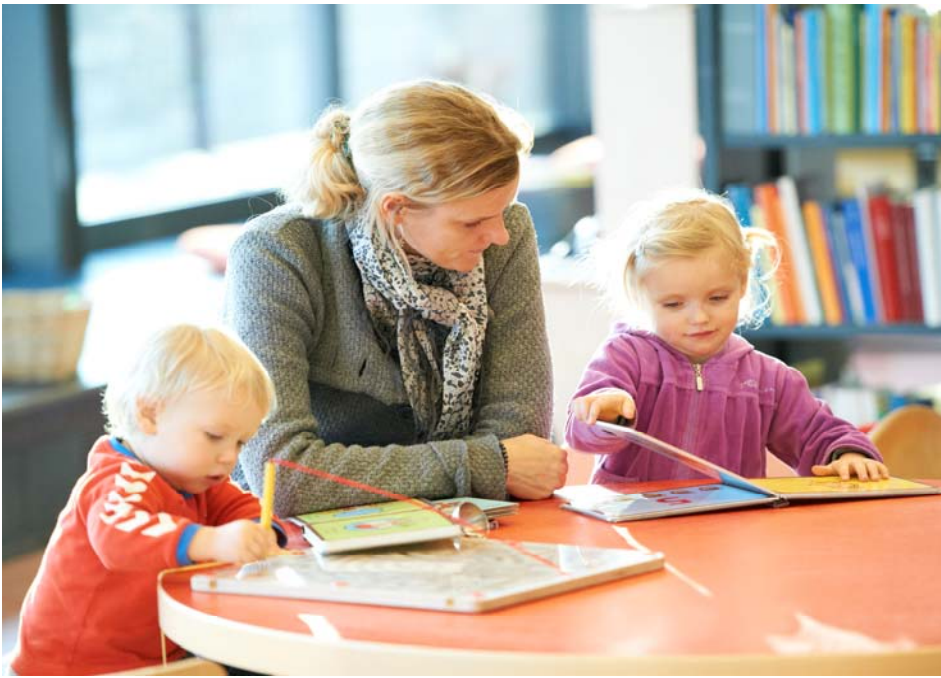
Leg og læring går hånd i hånd på Albertslund Bibliotek.