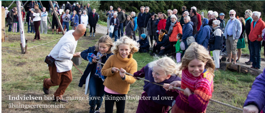
Indvielsen bød på mange sjove vikingeaktiviteter ud over åbningsceremonien.