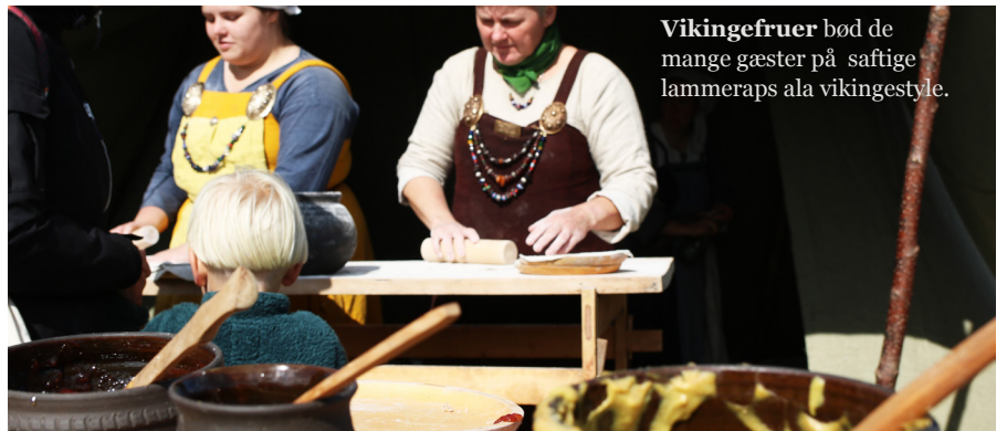
Vikingefruer bød de mange gæster på saftige lammeraps ala vikingestyle.