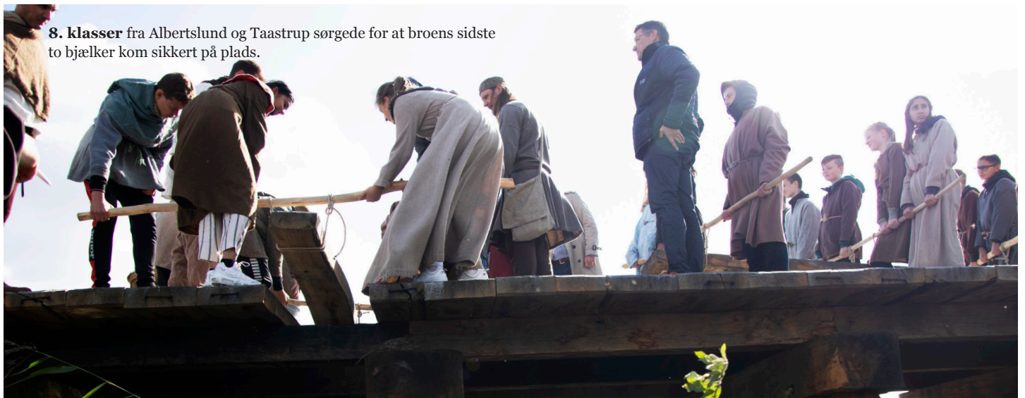
8. klasser fra Albertslund og Taastrup sørgede for at broens sidste to bjælker kom sikkert på plads.