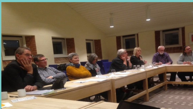
Kontaktudvalgets tur gik til HKs kursussted i Rødvig på Stevn.

Vil du vide mere om hele vores MED-organisering og MED-aftalen så gå ind på medarbejdersiden/MED